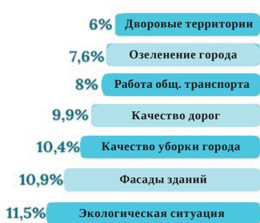
Рис. 1. Что необходимо изменить в городе? (анкетный опрос, допускалось несколько вариантов ответа)

По результатам анкетного опроса, жители выделяют проблемные зоны в городе, решение которых позволит городской среде стать более комфортной. На рис. 1. представлены Топ 7 запросов кемеровчан на изменение городской среды. На основе проведенного исследования нами были выделены ключевые запросы горожан.