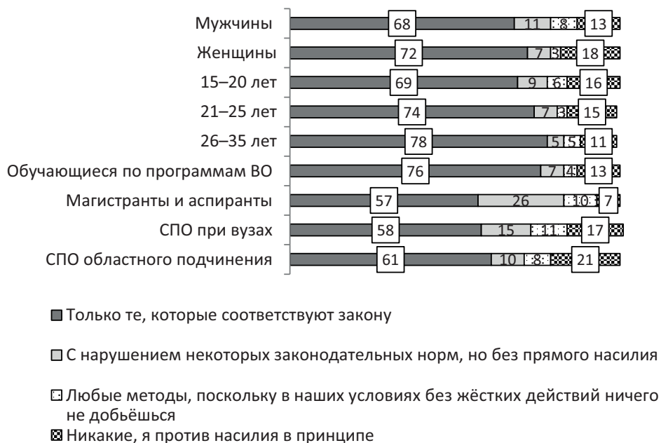
Рис. 1. Распределение ответов на вопрос: «Какие методы борьбы при отстаивании интересов, ценностей Вы считаете допустимыми?» по полу, возрасту и программам обучения, %

правовом бескультирии, социально-правовом негативизме, цинизме. Противостоять деструктивным идеологиям способен молодой человек с высоким уровнем правосознания.