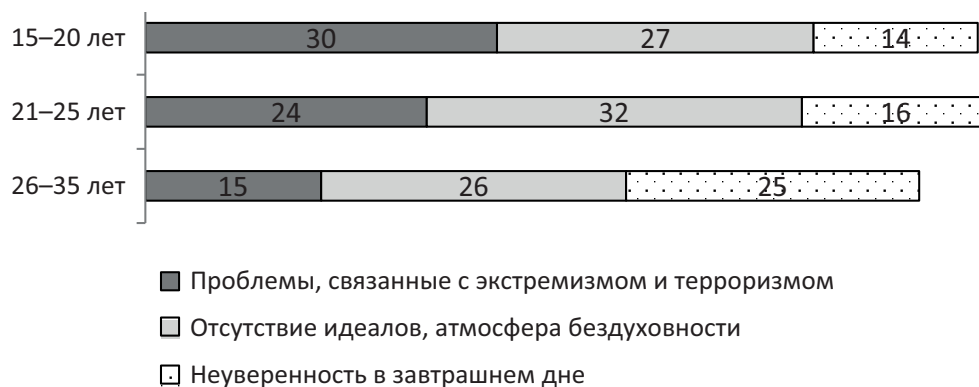
Рис. 4. Оценка социально-политических и социально-психологических проблем молодёжью Саратовской области в зависимости от возраста, %

в 2 раза чаще указывает молодёжь младшей возрастной группы (30%), чем старшей (15%). Неуверенность в завтрашнем дне осложняет жизнь современной молодёжи по мнению четверти (25%) старших респондентов (в возрасте 26–35 лет), что почти в 1,8 раза выше, чем с точки зрения молодых людей в возрасте 15–20 лет (14%). Молодёжь в возрасте 21–25 лет чаще указывает на отсутствие идеалов и атмосферу бездуховности (32%), чем младшая (24%) и особенно старшая (16%) молодёжь (рис. 4.)