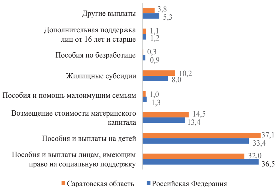
Уровень и структура социальных пособий, компенсаций и иных выплат, % к опрошенным (цвет онлайн). Источник: Федеральная служба государственной статистики. URL: https://www.rosstat.gov.ru (дата обращения: 15.06.2025)

Бедность, особенно среди работающих сограждан, во многом является результатом экономического неравенства трудоспособного населения на рынке труда. Поэтому важно регулирование доходов населения через минимальный размер оплаты труда (МРОТ). Он рассчитывается на основе величины прожиточного минимума (ПМ), который ежегодно устанавливается законодательно. С 1 января 2025 г. МРОТ составляет 22 440 руб. в месяц; это примерно 150 евро, в то время как в Скандинавских странах – 1000 евро [15]. На эту величину влияют общая экономическая ситуация, размер за-