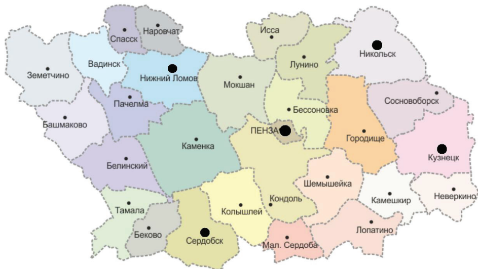
Карта Пензенской области

мости от целей и задач города классифицируют по следующим признакам: административное значение (областной центр, районный и пр.); народнохозяйственное значение (промышленный центр, транспортный узел, курорт и др.); местные естественно-исторические особенности и др. Но наиболее распространенной является классификация по численности населения, которая приведена в ст. 5 Градостроительного кодекса Российской Федерации от 7 мая 1998 г. № 73-ФЗ 16 : малые города и поселки (численность населения до 50 тыс. чел.); средние города (от 50 до 100 тыс. чел.); большие города (от 100 до 250 тыс. чел.); крупные города (от 250 тыс. до 1 млн чел.); сверхкрупные города (свыше 3 млн чел.); крупнейшие города (от 1 млн до 3 млн чел.).